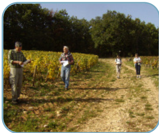
Travail sur le terrain.

Une formation cartographie orientation de niveau 2 sera proposée en 2011 ainsi qu'une formation UFCA (Unité de Formation Commune aux Activités) en priorité pour les personnes se destinant à encadrer au niveau de leur Club.