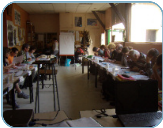
Travail en salle.

Formation : les 8 et 9 octobre a eu lieu une formation niveau 1 de cartographie orientation, ouverte au niveau national, aux adhérents souhaitant une formation personnelle, ou commençant un cursus de formation d'initiateur de randonnée, sports de neige inclus, ou d'alpinisme.